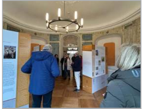
Ausflug des Neuhauskreises am 22.03.26 nach Königshain zur Schachmann-Ausstellung: „Schachmann: Kunstsammler und Visionär“ im Schloss.