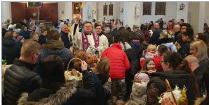
Speisensegnung. Wie in jedem Jahr gab es am Karsamstag wieder die Speisesegnung. Zur Klosterkirche nach Weinhübel und in die Heilig Kreuz Kirche fanden aus diesem Anlass viele Menschen.