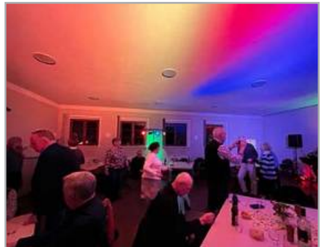
Musikalischer Gemeindeabend am 24.04.26 im Klemens-Neumann-Heim mit exzellenter handgemachter Musik aus den Siebzigern