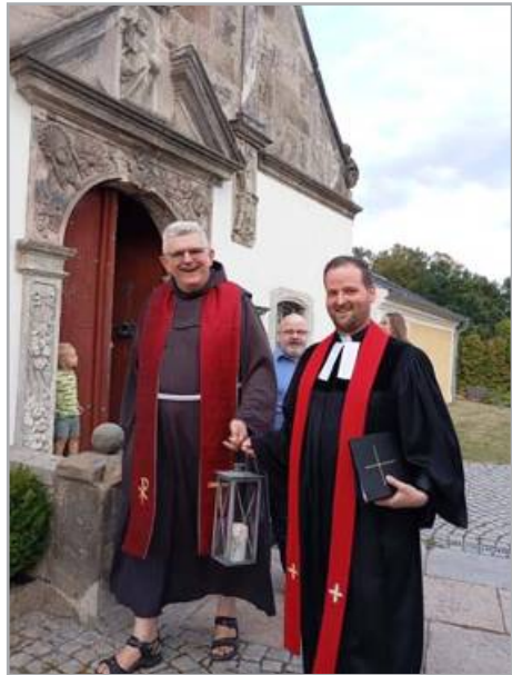
Eine Dankandacht für drei Jahre ökumenische Gastfreundschaft in Jauernick, August 2026