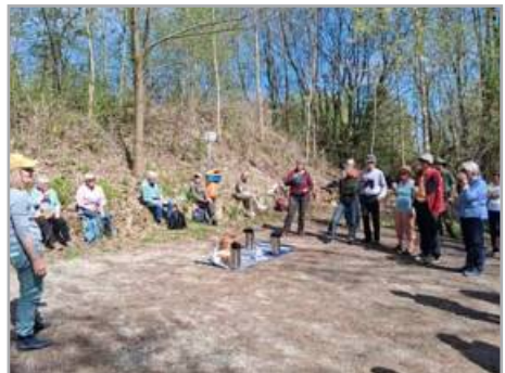
Schöpfungstag am Berzdorfer See 18. April von Joachim Scholz

Ökumenisches Radpilgern vom 1. bis 5. September 2026 mit Start in Meißen und Ziel in Senftenberg, TIn: 250 €, Anmeldung bis 30. Juni im Seelsorgeamt, www.bistum-goerlitz.de/anmeldung