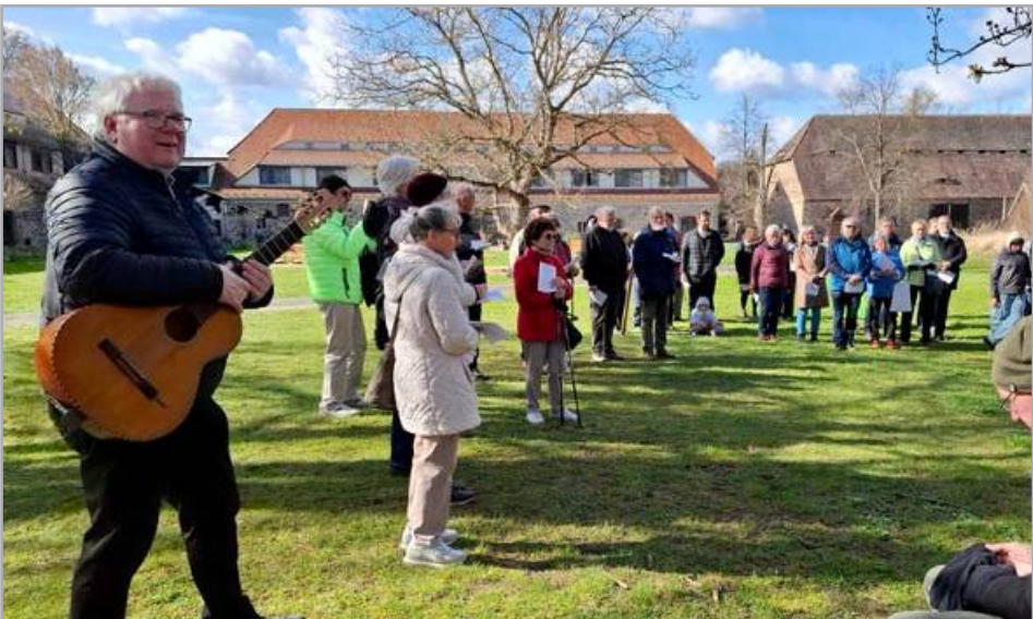
Emmausgang von der evangelischen Kirche in Tauchritz zum Berzdorfer See, Fotos: Gabi Kretschmer