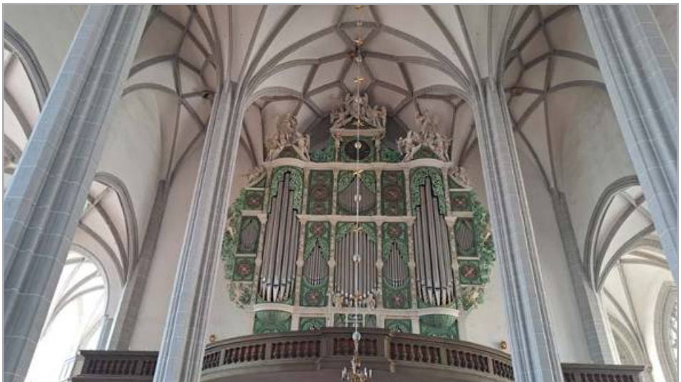
Sonnenorgel in der Peterskirche in Görlitz, Foto: Thomas Krakowsky