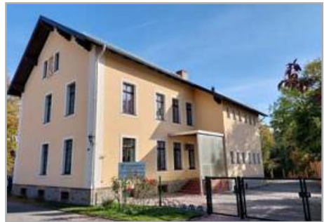
Fotos: Gleicher Kindergarten, unterschiedliche Zeit

Ehemalige Kinder, Eltern, Erzieher, Nachbarn und alle Interessierten sind herzlich eingeladen, gemeinsam in Erinnerung zu schwelgen und die Zukunft unserer Kleinsten zu feiern. Der Eintritt ist frei.