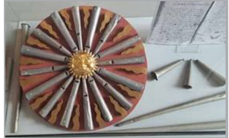
Originale Sonne aus der Sonnenorgel um 1703

Orgelnacht beginnt um 15:30 Uhr mit einem Konzert für Violine und Orgel an der Sonnenorgel der Peterskirche. Um 17:30 Uhr schließt sich ein Improvisationskonzert nach Publikumswünschen an der Jehmlich-Orgel der Lutherkirche an, gefolgt um 19:30 Uhr von der Schuster-Orgel der Frauenkirche mit einem Konzert für Sopran, Trompete und Orgel. Die Eule-Orgel der Kathedrale St. Jakobus erle-